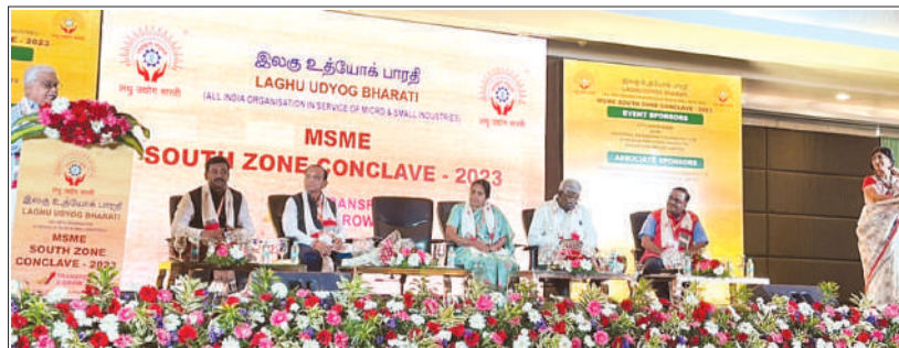
LUB's National President Shri Baldevbhai Prajapati addressed the South Zone Conclave conducted by Tamil Nadu State Unit on 8th January, 2023. National General Secretary Shri Ghanshyam Ojha and other Officials are seen on dais.