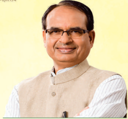
शिवराज सिंह चौहान, मुख्यमंत्री