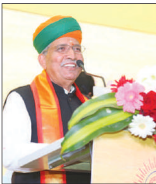
APJ Abdul Kalam