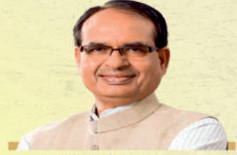
श्री शिवराज सिंह चौहान, मुख्यमंत्री