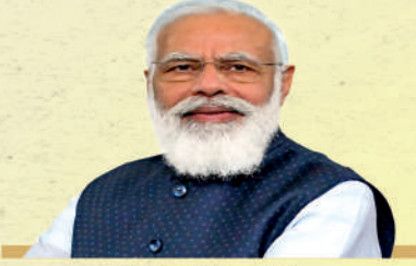
श्री नरेन्द्र मोदी, प्रधानमंत्री