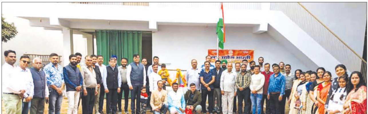
National Flag Hosting Ceremony organized by LUB's Katni Unit of Madhya Pradesh State on Republic Day.