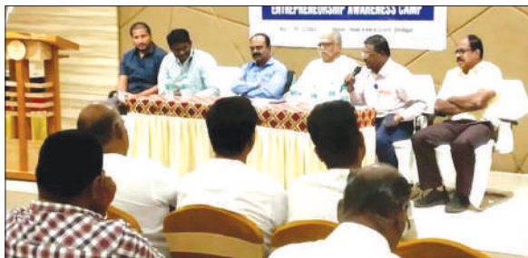
LUB's Dindigul Unit of Tamil Nadu State conducted the Meeting of Executive Council.