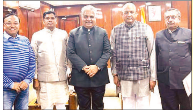
LUB's High Level Delegation met with Union Minister Shri Bhupendra Yadav for Misleading Provisions for Plastic Manufacturers and Traders on 12th December at New Delhi.