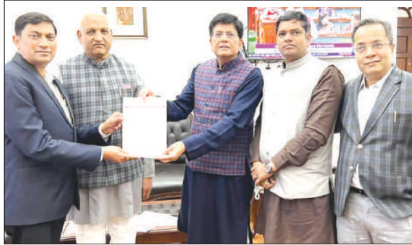
Delegation of LUB's Bhilwara Unit headed by National Organizing Secretary Shri Prakash Chandra met Union Minister for Textile Shri Piyush Goyal at New Delhi. National Secretary Shri Naresh Pareek is also seen with other officials.