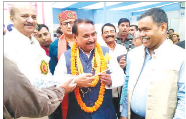
Union Minister Shri Bhanu Pratap Singh Verma receiving Memento 'Trishul' while visiting the Stall of Kashi Prant.