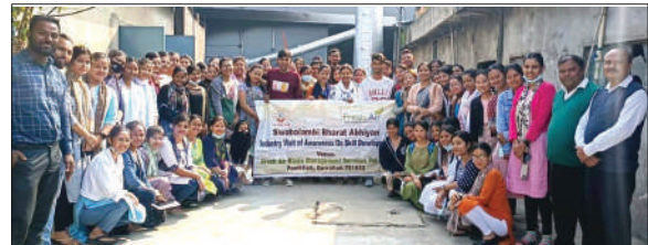
An Industry Visit for Awareness on Skill Development was conducted under Swavlambi Bharat Abhiyan at Panikhati by LUB's Guwahati Unit.