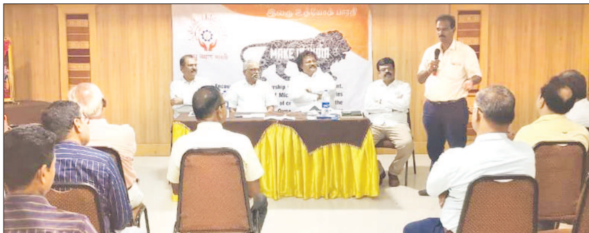
LUB's Tamil Nadu State General Secretary addressed a Meeting at Dindigul and Madurai during Prawas on 30th May, 2023.