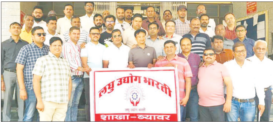
LUB's Beawar Unit of Rajasthan Demonstrated under State wide Protest against Fuel Hike and handed over a Representation to SDM on 16th May, 2023.