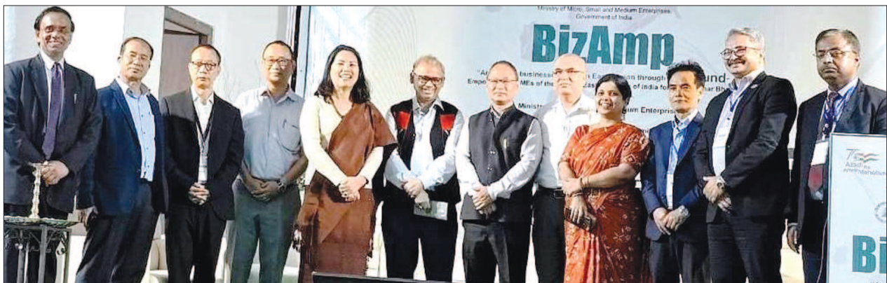
LUB's North-East Unit conducted a Special Interactive Session with Local Entrepreneurs and Industrialists at Dimapur (Nagaland) and Inspired for Membership on 4th May, 2023.